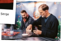
RED STARS WEIDENREIM 78 E.V. - Für Thomas Tuchel ging es nach Baden-Württemberg.