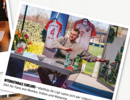
INTERNATIONALE FANCLUBS - Matthijs de Ligt nahm sich per Videokonferenz Zeit für Fans aus Mexiko, Indien und Malaysia.