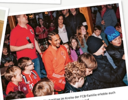
DIE 13 WÜGLWANGER E.V. - Einen Nachmittag im Kreise der FCB-Familie erlebte auch Leroy Sané. Inmitten der kleinen Fans ging ihm das Herz auf.