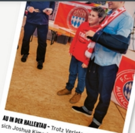
AU IN DER HALLETTAU - Trotz Verletzung nimmt sich Joshua Kimmich gern Zeit für die Fans.