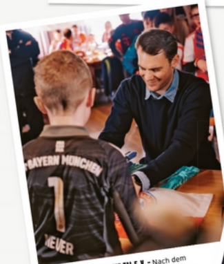
BAYERNFREUNDE TEGENSEE TAL E.V. - Nach dem Bierkrugstemmen erfüllte Manuel Neuer jede Menge Autogrammwünsche.