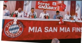
MIA SAN MIA FINSING - In Niederbayern fühlte sich Serge Gnabry herzlich willkommen.