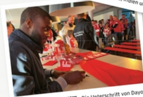
MASCHINENFABRIK REINHAUSEN - Die Unterschrift von Dayot Upamecano war in Regensburg heiß begehrt.