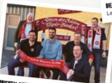
ORIENTAL-BAYERN ASCHAU - Sven Ulreich durfte auf dem Triple-Bankeri Platz nehmen.